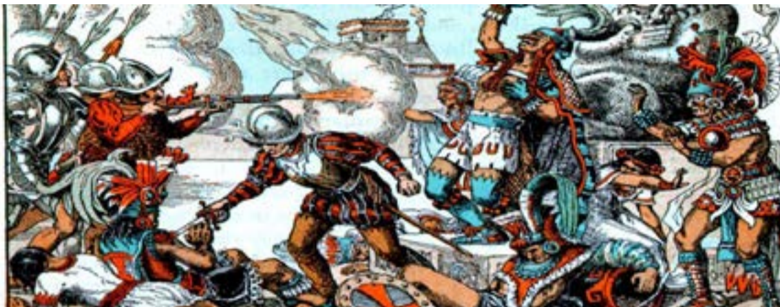
Pintura alusiva al genocidio español contra las comunidades indígenas.