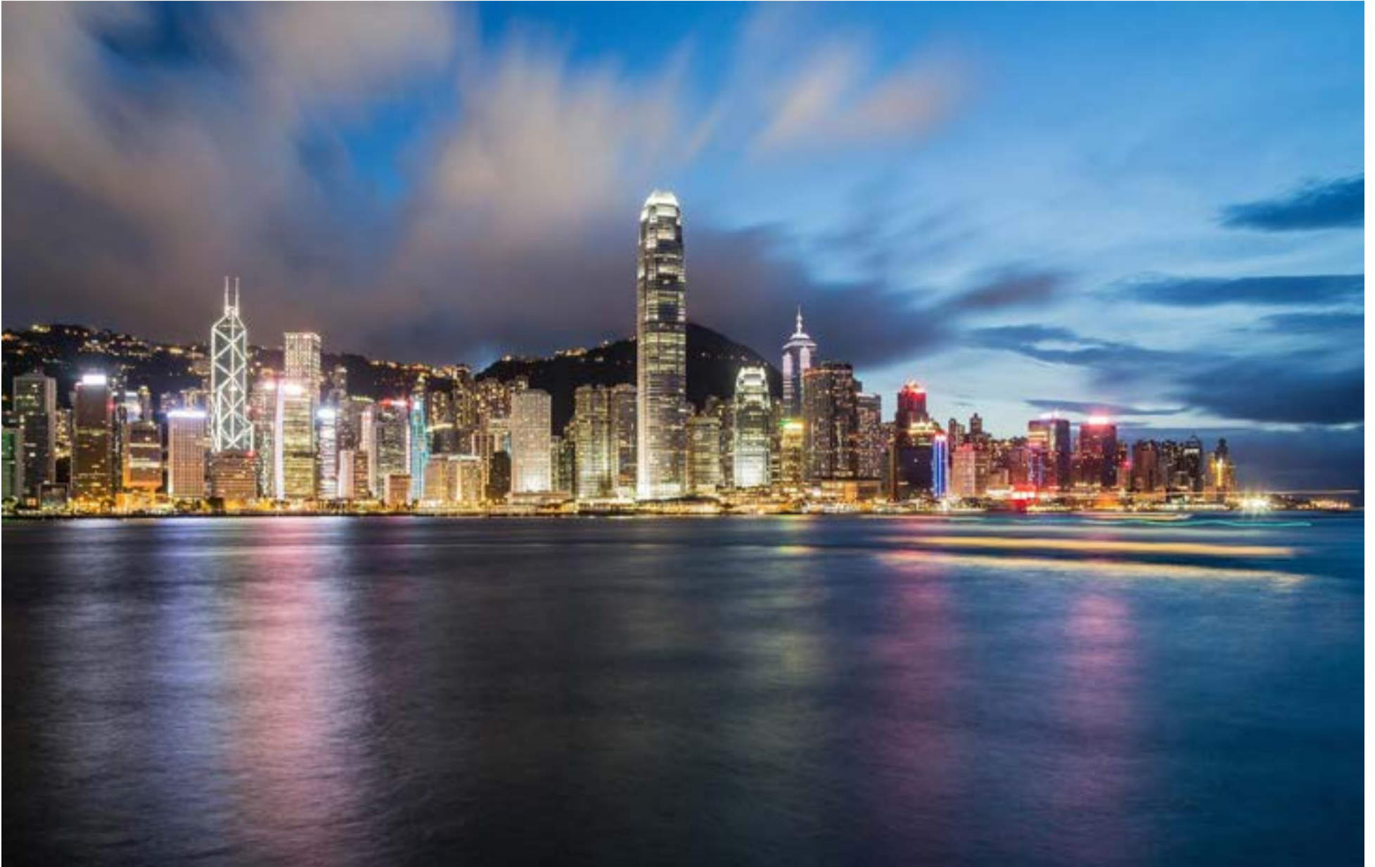
El sector financiero de Taiwán

Taiwán a través de misiones médicas, personal de servicio juvenil en el exterior, programa de voluntarios, proyectos crediticios e inversiones y proyectos de asistencia técnica y humanitaria.