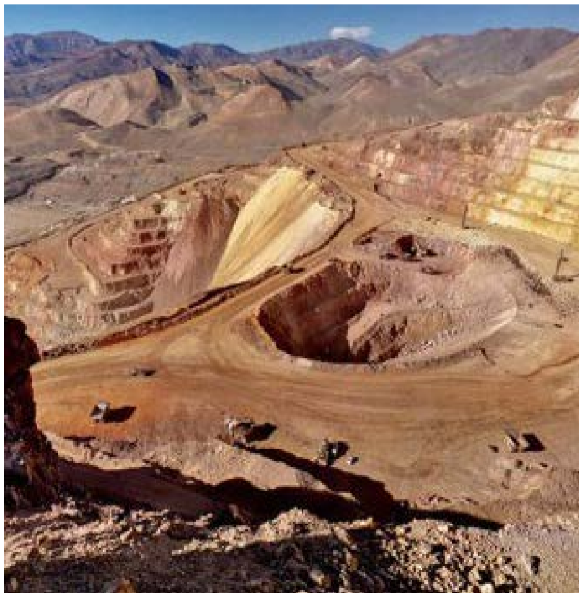
Destrucción y muerte deja el mercurio a su paso, en busca de oro.

del Chocó. Así lo explicó uno de los traficantes.