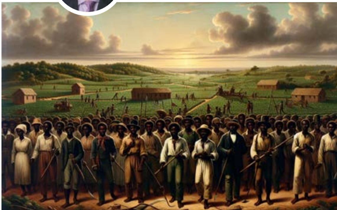
La abolición de la esclavitud en Colombia, finalizada en 1851, fue un proceso complejo marcado por la resistencia afrodescendiente y cambios legislativos. La población esclavizada, jugó un rol crucial en la economía, especialmente en la minería y agricultura.

nes en honor a las comunidades negras, afrocolombianas, raizales y palenqueras. Este gesto, lejos de ser simbólico, es un llamado a que las instituciones estatales y la sociedad civil reconozcan la deuda histórica y se comprometan con la erradicación de cualquier forma de racismo y discriminación.