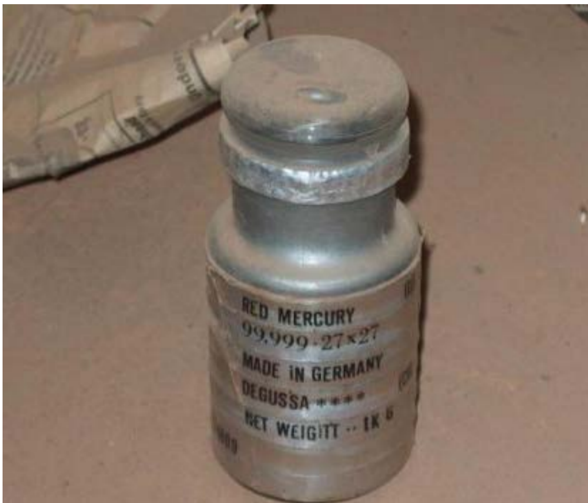
Se estima que anualmente en el país se liberan 75 toneladas del metal.

Gran parte del mercurio que entra irregularmente al país es transportado hasta Medellín, desde donde se distribuye a minas ilegales en el norte de Antioquia y gran parte