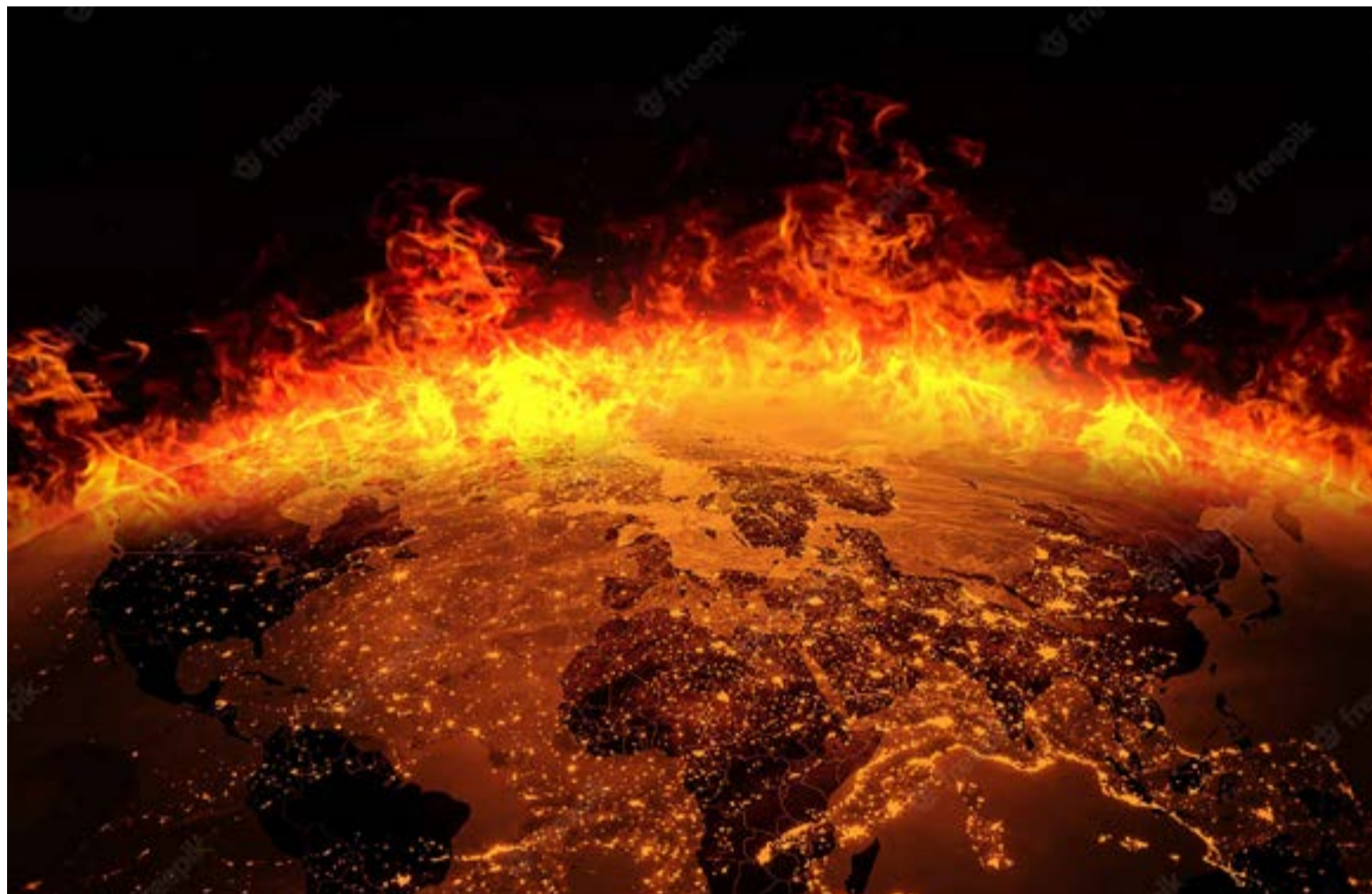
Así arderá la tierra para luego evaporarse.

Una vez formada, y dejada en paz como colección de metales y rocas cubierta por una delgada película de agua y aire, la Tierra podría existir para siempre, al menos por lo que sabemos hoy. Pero ¿la dejarán en paz? La respuesta es no. Entonces, ¿cómo y cuándo será el fin del mundo?