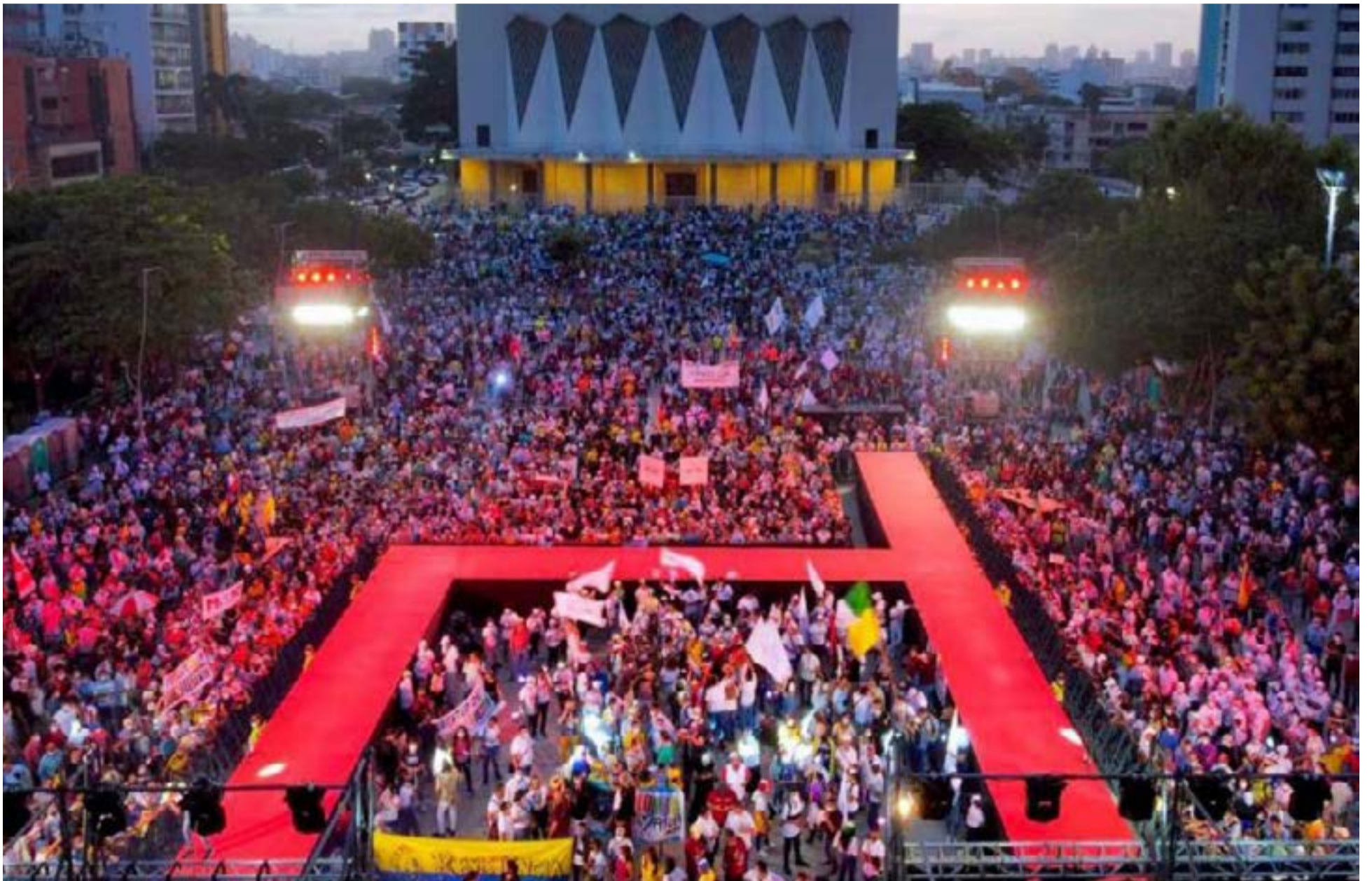
Pugna política que fracturó a Colombia Humano